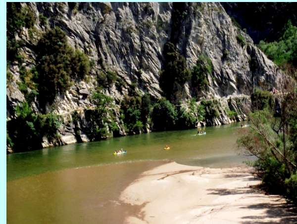
Staza iznad reke

Vratili smo se na polazno mesto i otišli za Kavalu gde smo se zadržali oko 3 sata.