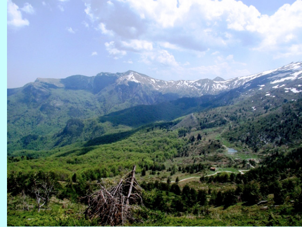
Istocni deo Kozufa

Dužina ture je bila oko 13km, uspona oko 750m, vreme trajanja 5 sati, broj učesnika 20. Po završetku ture vratili smo se u Đevđeliju i otišli za Grčku u mesto Orfanio gde smo prenoćili četiri naredne noći.