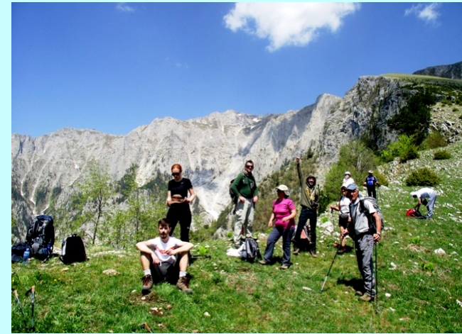
Na prevoju južnog oboda

Uspon dalje ide desnim golim obodom velikog južnog „kratera“ planine. Posle nekoliko uspona na nekoliko „predvrhova“ dolazimo na najviši vrh Sv.Ilija-2233m.