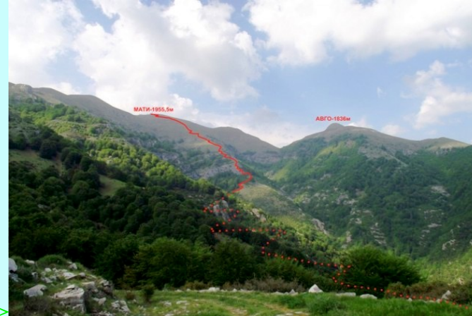
Trasa uspona na Pangeo