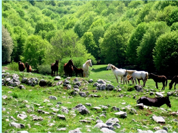
Prvi proplanak i kraj sume

pobegoše. Voda je već presušila. Uspon dalje ide desnim golim obodom velikog južnog „kratera“ planine.