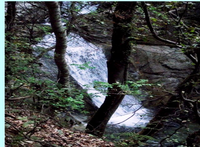
Jedan o desetak slapova

Dalje staza vodi na drugu stranu doline ali mi smo nastavili da se penjemo prvo direktno uz kameniti strmi greben a kasnije travnatim grebenom sve do glavnog vrha Mati-1955,6m. Vratili smo se u selo drugom zapadnijom stazom.