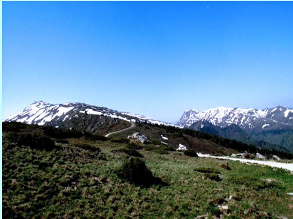
Prvi pogled na planinu