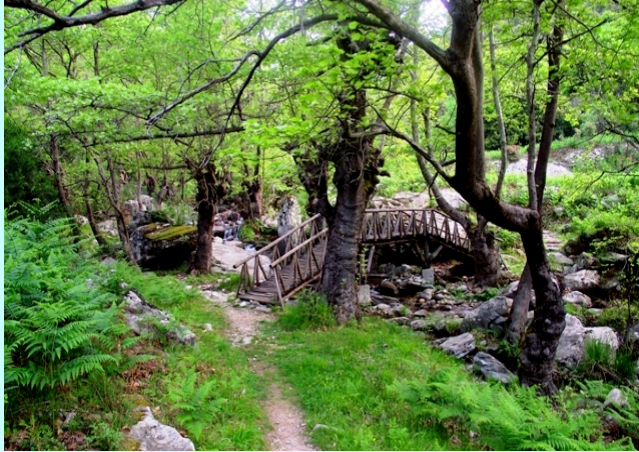
Mostici na brzjoj reci

Preko reke su urađeni mostići a na padinama drvena ograda. Ova staza vodi do jedne pećine iz koje izvire reka uz koju smo išli.