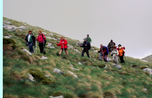
Pocetak dugog silaska