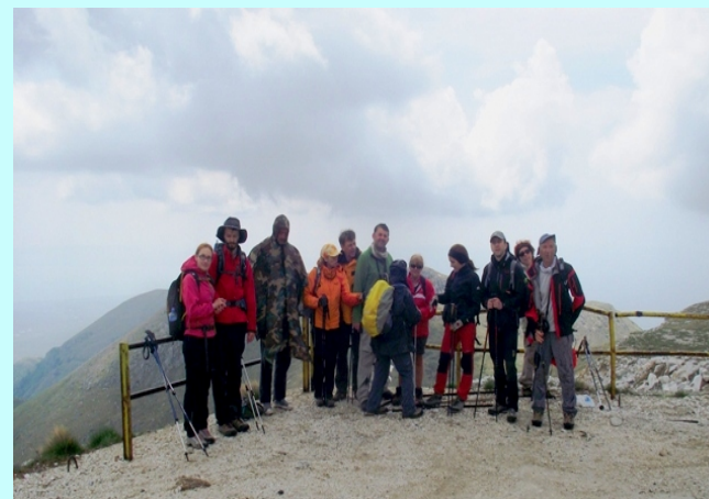
Na vrhu Mati-1955m

Dužina ture je bila oko 19km, uspona oko 1700m, vreme trajanja 10 sati, broj učesnika 13.