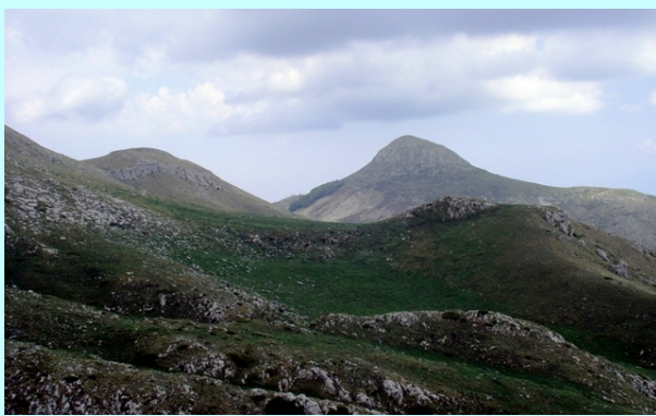
Avgo ili Pilavtepe-1836m