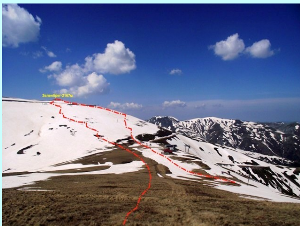
Zelenbreg, trasa uspona i silaska

Zatim graničnom stazom silazimo na prevoj gde se nalazila karaula Markovo ezero a odatle se snežnom padinom penjemo se na najviši vrh planine Zelenbreg-2167m. Vrh je na granici Makedonije i Grčke.