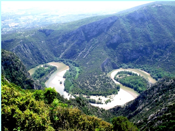
Završni meandri Neste

Odozgo se ne vide svi meandri reke Neste već samo poslednja tri. Zatim smo se vratili u izlazni deo klisure i prošetali stazom uklesanom u stene oko kilometar uzvodno. Staza se nalazi iznad reke i pruge sa dosta tunela.