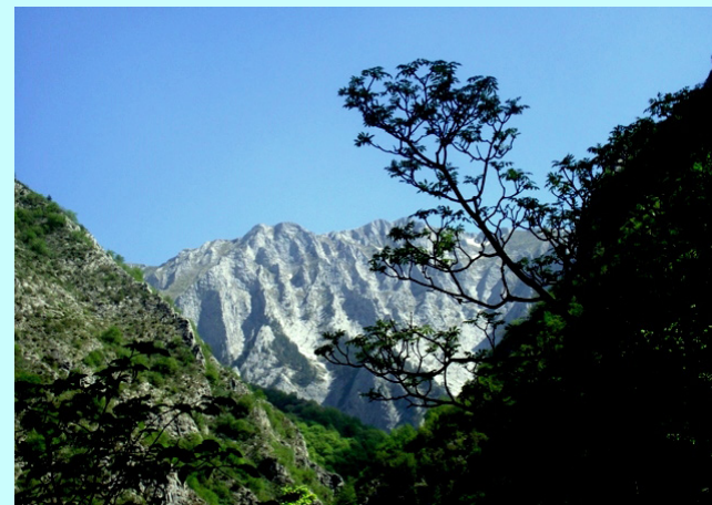
Pogled na juzne stene

Staza je delimično zarasla ali ima oznaka pored pa je moguće proći klisurom. Na sledećem raskršću skrećemo desno uz strmu stazu ukopanu u steni. Kasnije szata je prilično zarasla i zatrpana lišćem kao da njome niko ne prolazi. Na kraju te doline izlazi se na proplanak sa bukovom šumom na kome se nalaze korita za pojenje stoke i jedna crkvica. Tu zatekosmo krdo konja i magaraca ali brzo