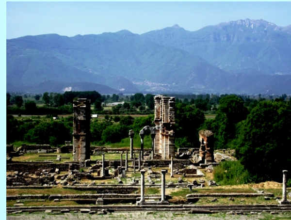
Lokalitet Filipi, u pozadini Pangeo

Odozgo se ne vide svi meandri reke Neste već samo poslednja tri. Zatim smo se vratili u izlazni deo klisure i prošetali stazom uklesanom u stene oko kilometar uzvodno. Staza se nalazi iznad reke i pruge sa dosta tunela.