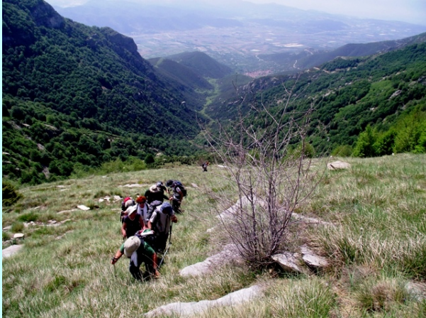
Daleko u daljini selo Mesoropi