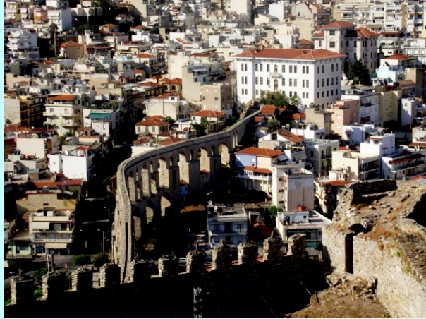
Akvadukt u Kavali