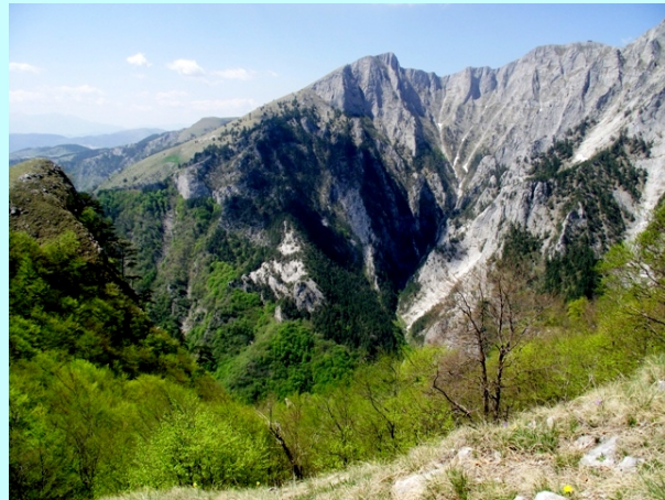
Jos malo pa vrh

Uspon dalje ide desnim golim obodom velikog južnog „kratera“ planine. Posle nekoliko uspona na nekoliko „predvrhova“ dolazimo na najviši vrh Sv.Ilija-2233m.