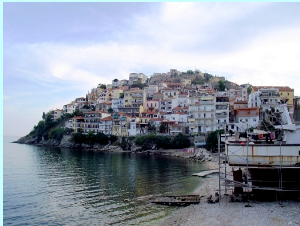
Kavala, stari deo grada sa tvrđjavom

Neki su obilazili grad a neki su ostali na plaži istočno od grada.