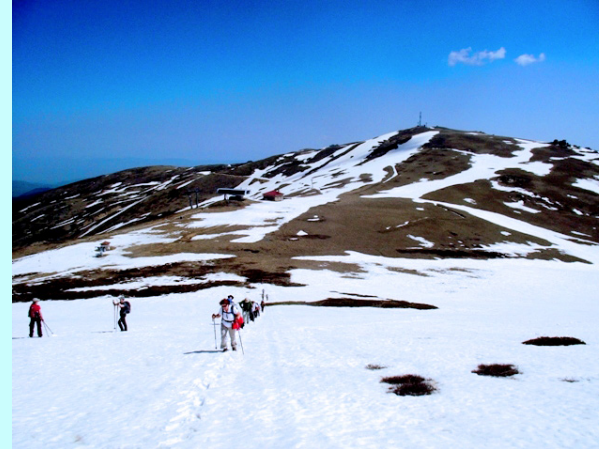
Silazak sa kote 2112m

Zatim graničnom stazom silazimo na prevoj gde se nalazila karaula Markovo ezero a odatle se snežnom padinom penjemo se na najviši vrh planine Zelenbreg-2167m. Vrh je na granici Makedonije i Grčke.