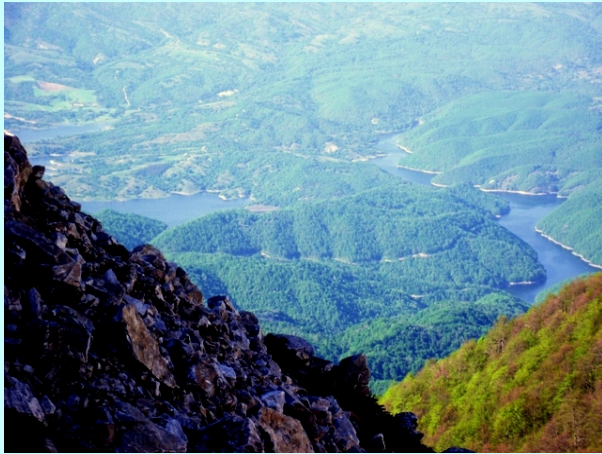
Jezera reke Neste

03.05 FILIPI, KLISURA REKE NESTE, KAVALA. Prvo smo otišli u obilazak lokaliteta Filipi, severno od Kavale. Zatim smo nastavili put na istok i pre Ksantija skrenuli levo kod sela Statmos. Strmim putem smo otišli do jednog vidikovca na desnoj strani klisure reke.