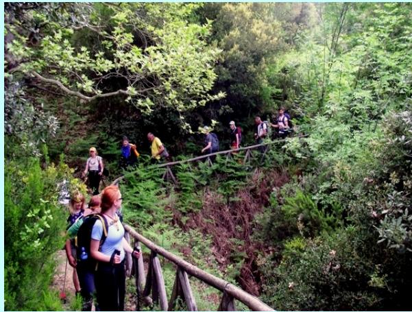
Uredjena staza uz dolinu reke

Preko reke su urađeni mostići a na padinama drvena ograda. Ova staza vodi do jedne pećine iz koje izvire reka uz koju smo išli.