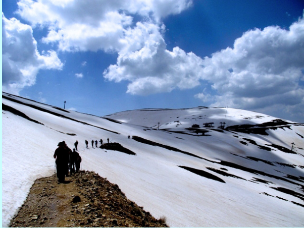
Silazak sa vrha